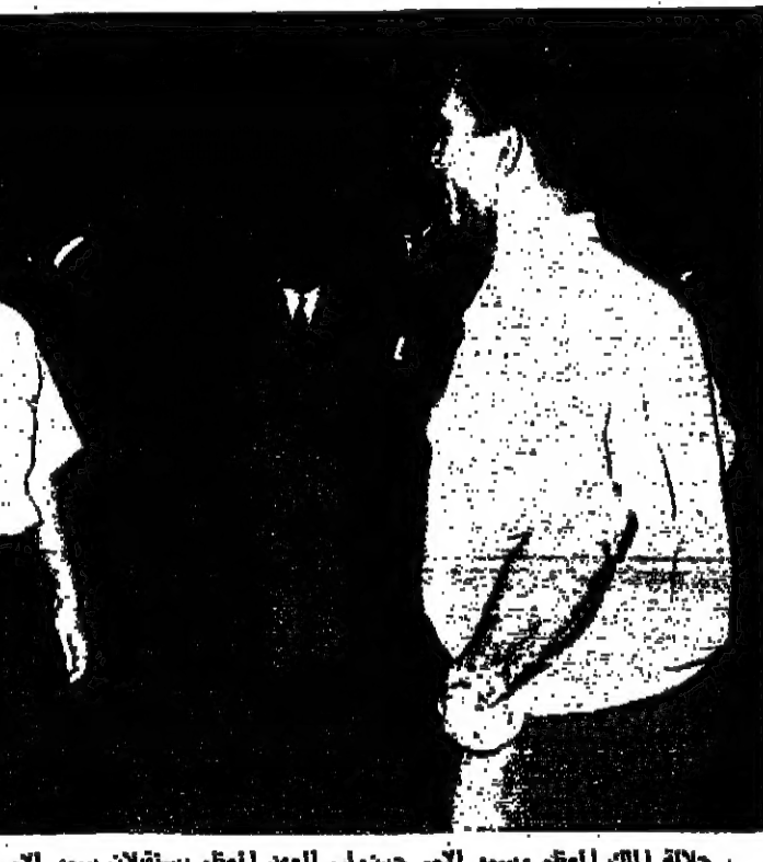
جلالة الملك المعظم وسمو الامير حسن ولي العهد المعظم يستقلان سمو الامير محمد صباح امس من بريطانيا

القاهرة - استأنف المجلس القومى الفلسطينى اجتماعه الساعة السادسة من مساء امس وانتهى الاجتماع الساعة التاسعة. وصرح السيد عبد المحسن قطان رئيس المجلس بان المجلس انتهى مساء امس مناقشة كل الموضوعات العسكرية والمالية والتنظيم الشعبية المتعلقة بالعمل الفلسطينى في المرحلة القادمة. وتعدى الاجتماع الذي ابيت خلال المباحثات اثناء التي ابيت في القس العامة. وقال ان لجان المجلس ستبايع اليوم مناقشة الموضوعات على ضوء